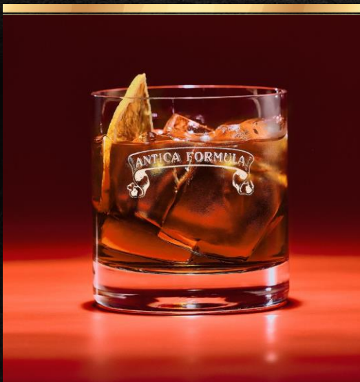
ANTICA PERFECT SERVE